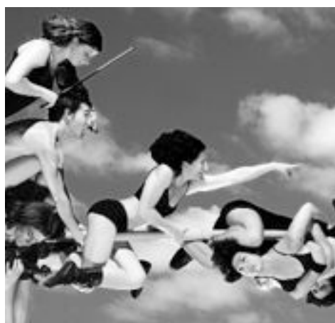
SANOS Y SALVOS

Es el circo nuevo, ese que permite disfrutar de la más alta destreza, del entrenamiento sostenido, la transpiración y pasión de sus intérpretes. Ese que reta al riesgo, que hace vibrar al espectador, que pone en evidencia la más pura desnudez humana. Desnudo por la belleza, la fragilidad de sus cuerpos, porque es posible la falla humana aunque no acontezca: la performance es casi perfecta. Los músicos unen mundos: lo sublime y lo terreno. La apropiada intervención de los instrumentos marca los instantes de tensión extrema, cuando algún integrante va a acometer una peripecia de gran peligro. Entonces, se acerca un saxo, un violín (o algún otro) y lo acompaña, lo contiene, y la música hace las veces de red. Pero una vez superada esa zona vertiginosa, los integrantes de la Compañía se