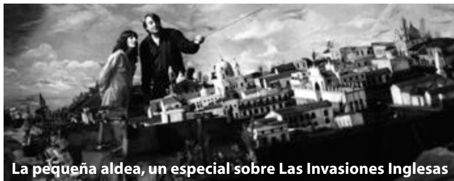
La pequeña aldea, un especial sobre Las Invasiones Inglesas

Mis Cajas (2006) Tres 'clowns' invitan a descubrir