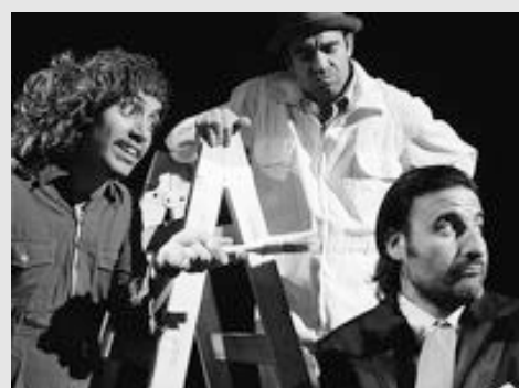
"Los desvalijadores" de El Trasto.

No hay dudas sobre el potencial de vidriera de los festivales, resta ahora estimular sus potenciales de usinas, de fábricas, de laboratorios... y para eso nada mejor que buscarles funcionalidad más allá del éxito aparente. El festival, a diferencia de la fiesta, tiene en el efecto residual su fase más importante. Si en la fiesta el encuentro y la celebración son la propia efectividad del evento, en el festival la fase prospectiva es determinante, su "para qué" es lo que lo define y legitima en su comunidad. Para que esto suceda existen los curadores, los encargados de elegir aquellos artistas, aquellas obras, aquellos cursos, aquellos eventos que juntos conformen un todo orgánico, un cuerpo/corpus, una proposición proyectiva que pueda abastecer necesidades artísticas, señalar rumbos, descubrir misterios, sembrar inquietudes y sobre todo prometer que la resaca posterior será más nutritiva que la propia fiesta.