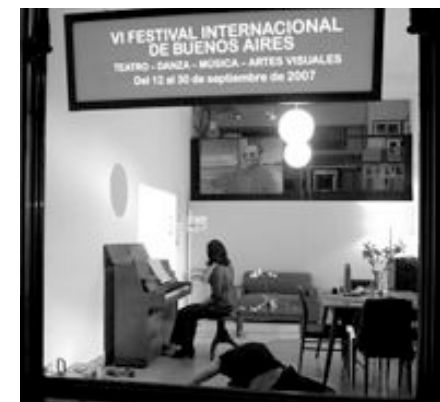
por M. W.

Ya se encuentra abierta la convocatoria para participar en las diversas programaciones que brinda el Festival para: Teatro - Danza - Música - Artes Visuales.