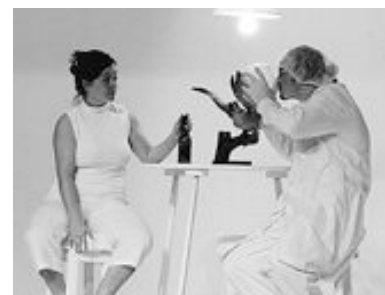
"Procusto" de la Compañía OANI de Teatro de Brasil.

Instituto Nacional del Teatro) procuran reunir los recursos mínimos para ofrecer alojamiento y comida a los actores y directores invitados. En muchos casos, las propias compañías teatrales participantes deben solventar sus gastos de traslado desde su lugar de origen. Asimismo algunos festivales surgieron del interés de un organismo oficial de fomentar el crecimiento de la actividad teatral en una determinada región; o de una organización conjunta entre exponentes del teatro independiente y funcionarios gubernamentales.