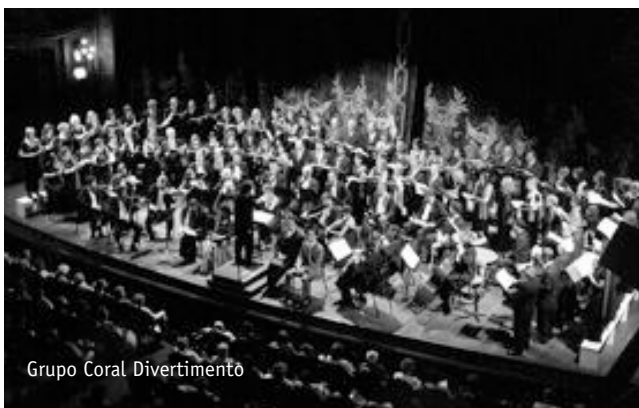
Grupo Coral Divertimento