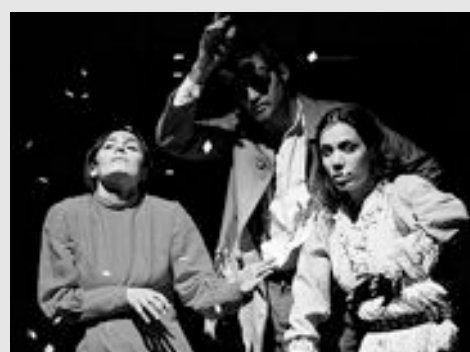
"Nave de los locos" de La Rueda de los Deseos.

encuentro se sostuvo con esta fisonomía. Luego, por desinteligencias de la gestión e ignorancia de sus organizadores, el festejo desapareció un par de años, para retomarse como "Festival de Estrenos de Mendoza", con una sola categoría y fecha en noviembre. No fueron pocas las críticas que recibió el municipio y el consecuente desprestigio de un festival que había surgido con fuerza.