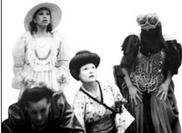
La negra Ester, Compañía Gran Circo Teatro, dir. Andrés Pérez Araya

El Festival Internacional de Teatro Mercosur toma en cuenta no sólo la programación de espectáculos internacionales, nacionales y locales, sino que abre su espectro planificando actividades de extensión, eventos especiales, foros, seminarios de formación y coproducciones.