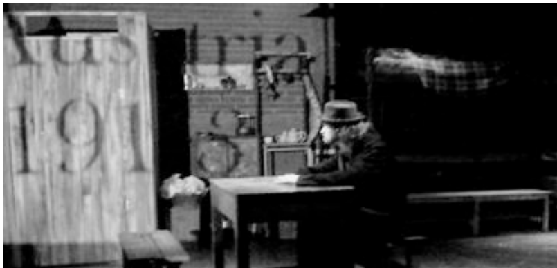
DAS BUCH DER ZEIT (FARSA DE CIENCIA FICCIÓN)