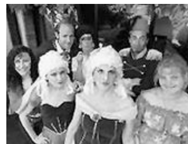
"Desvarios varios" del grupo Teatro de las Nobles Bestias de Temperley.

Muchos de estos encuentros surgen por iniciativa de uno o más grupos teatrales de una ciudad, que buscando apoyos gubernamentales (Secretarías de Cultura de Municipios o Provincia,