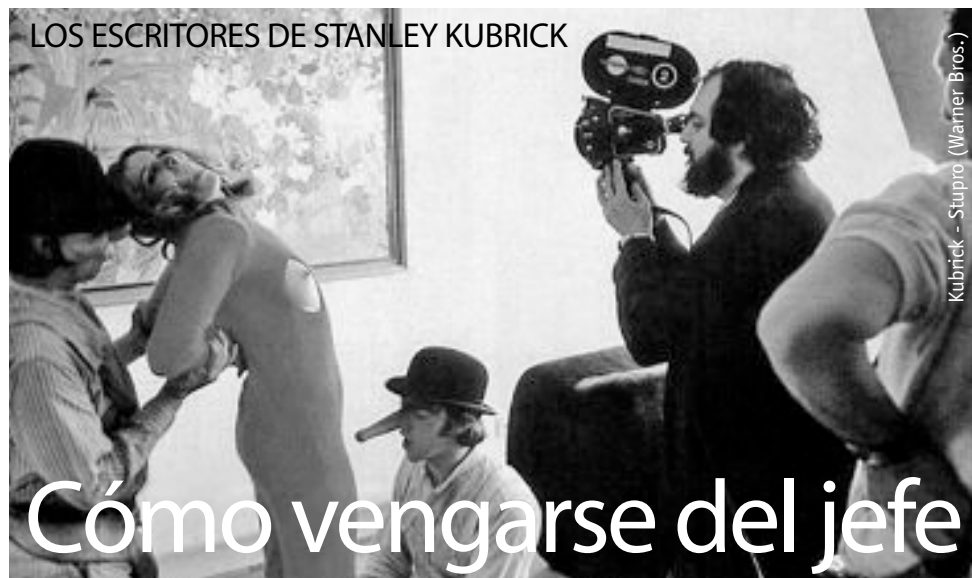
LOS ESCRITORES DE STANLEY KUBRICK