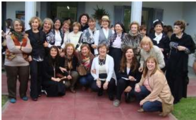
Integrantes del grupo El Sur Narra.

año, lo que permite tener un buen panorama para cualquier espíritu investigativo. Si tomamos como modelo comparativo al mundo del teatro independiente, en una foto actual podríamos visualizar algunas secciones: artistas que transitan formatos amateurs, otros que van buscando los caminos del profesionalismo, y un pequeño grupo que ya logró encontrar los mecanismos del mundo laboral con esta herramienta artística.